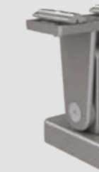
Steunvoet top voor serie-installaties, verstelbaar, in 3 hoogtes: 120–165, 165–210 en 210–255 mm