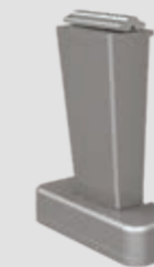
Steunvoet top, vast, in 4 hoogtes: 80, 120, 150 en 220 mm

WGM Top is leverbaar in de versies Stretch en OptiStretch , die voor een strak doek zorgen. Bij de uitvoering OptiStretch is het doek aan alle vier zijden vast gespannen. De voordelen: een bijzonder strak doek en geen lichtspleet aan de zijkanten. De basisversie Stretch is aan 2 zijden gespannen en tussen doek en zijprofiel bevindt zich een lichtspleet. Bij beide varianten zorgt een krachtig spansysteem met koorden voor een gelijkmatige doekstand.