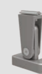
Steunvoet top, verstelbaar, in 3 hoogtes: 120–165, 165–210 en 210–255 mm